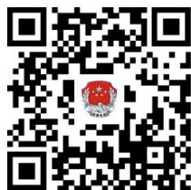
23. 省内变更执业机构许可（市内变更执业机构）

②网上办：抚顺政务服务网： http://zwfw.fushun.gov.cn/