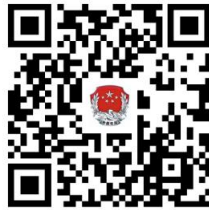
26. 司法鉴定机构更名

②网上办：抚顺政务服务网： http://zwfw.fushun.gov.cn/