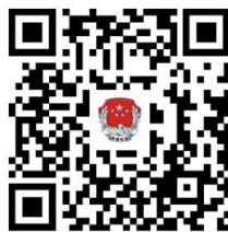
19. “两公一法” 律师变更为专职律师

②网上办：抚顺政务服务网： http://zwfw.fushun.gov.cn/