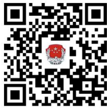
32. 司法鉴定机构增项

②网上办：抚顺政务服务网： http://zwfw.fushun.gov.cn/